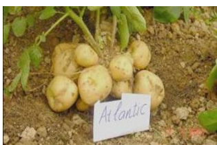
Potato ( Solanum tuberosum L.)