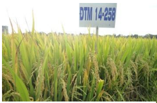
Rice ( Oryza Sativar )

Viện Khoa học Kỹ thuật Nông nghiệp miền Nam là một viện nghiên cứu nông nghiệp đa ngành, hoạt động trong các lĩnh vực: