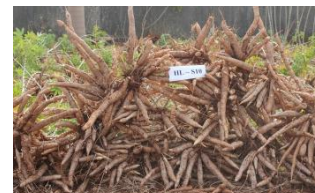
Cassava ( Manihot esculenta )