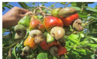
Cashew ( Anacardium occidentale L.)