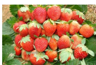
Strawberry ( Fragaria × ananassa )