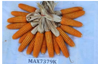
Maize ( Zea mays )