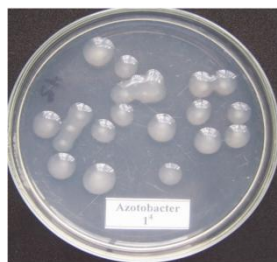
VSV cố định đạm - có khả năng cải tạo đất, nâng cao độ phì nhiêu đất

Ảnh hưởng của cơ giới hóa khâu làm đất đến lý tính của đất cho từng loại cây trồng cụ thể.