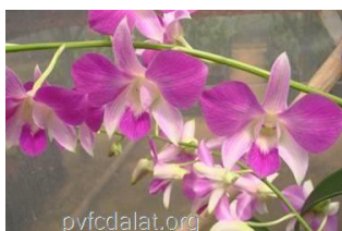
Dendrobium ( Dendrobium Sw. )