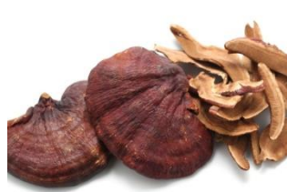
Lingzhi Mushroom ( Ganoderma lucidum (Curtis) P. Karst)