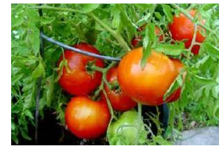
Tomato ( Solanum lycopersicum L.)