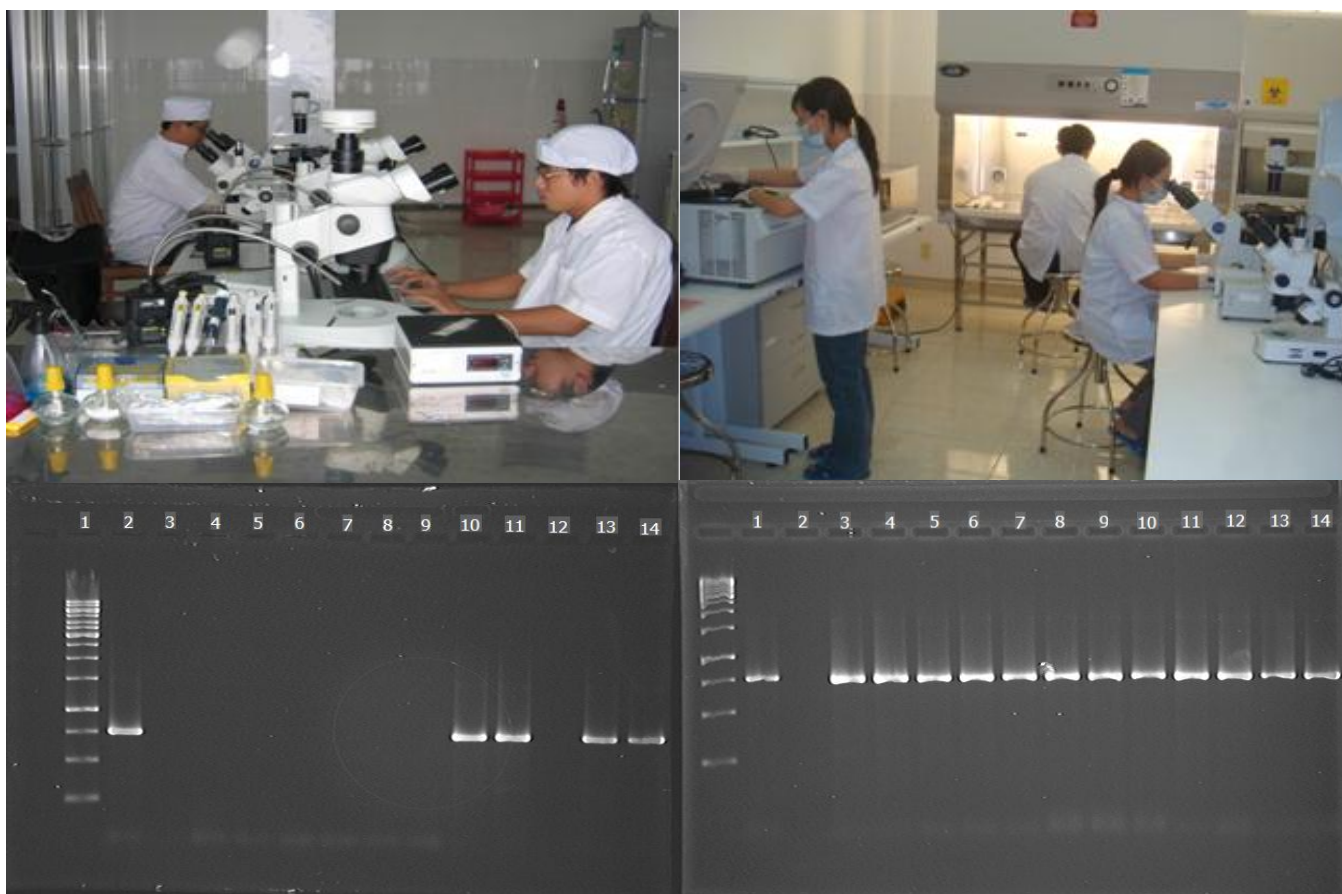
PCR product of tomato samples in Lâm Đồng Lane 1: 1 Kb ladder, Lane 2: positive control, Lane 3: negative control, Lane 4-14: DNA of tested tomato samples

Nghiên cứu quy trình công nghệ sinh học nhằm nâng cao giá trị dinh dưỡng, sử dụng các loại phế phụ phẩm công-nông nghiệp dùng trong chăn nuôi gia súc.