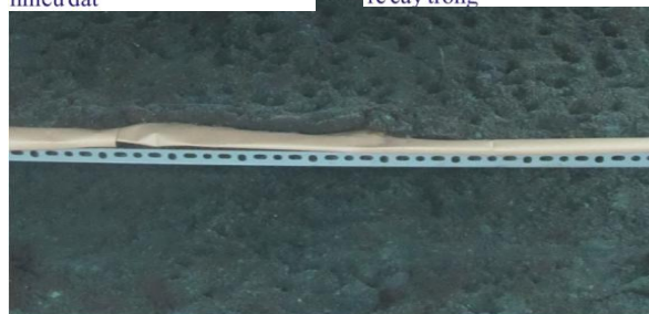
Sản xuất chế phẩm Trichoderma sp.