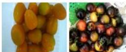
a) Cà chua bi đỏ b) Cà chua bi đen

Hai giống cà chua bi đỏ ( Santorini ) và đen ( Kumato ) (Hình 1) được sử dụng cho nghiên cứu này. Cà chua bi đỏ được trồng hữu cơ ở Cấn Thơ Farm, 79A Võ Văn Kiệt, phường Long Hòa, quận Bình Thủy, thành phố Cần Thơ. Cà chua bi đen được thu hoạch tại "Tổ sản xuất rau an toàn" - phường Châu Phú B, thành phố Châu Đốc, tỉnh An Giang. Trái được thu hoạch vào buổi sáng tại các vườn trồng, sắp xếp cẩn thận trong các thùng xốp và vận chuyển nhanh về phòng thí nghiệm.