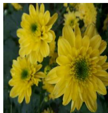
Hoa có kích thước nhị lớn ở dòng M2 (EMS 0,1% + UV)