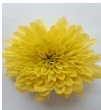
Dạng hoa tiêu biến nhị ở dòng M2 (EMS 0,1% + UV)