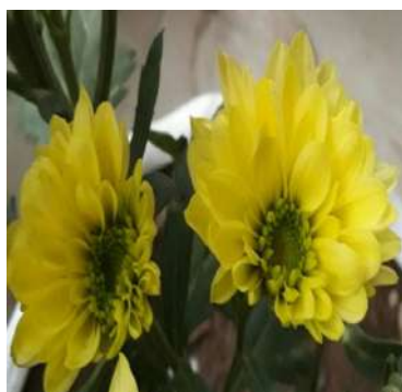
Hoa có cấu trúc thay đổi ở dòng M6 (EMS 0,3% + UV)