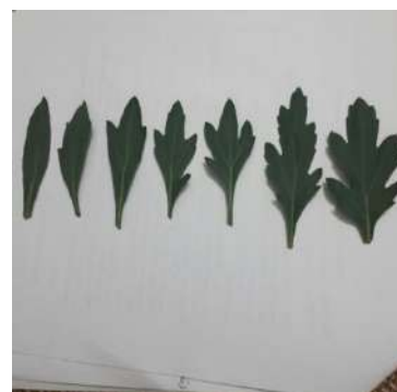
Biến dị hình thái lá ở dòng M6 (EMS 0,3% + UV)