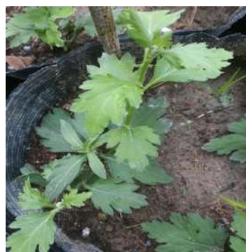
Biến dị hình thái lá ở dòng M6 (EMS 0,3% + UV)