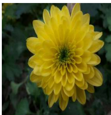
Hoa bình thường ở dòng M0